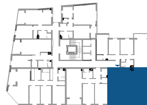
POZICIJA STANA U ZGRADI