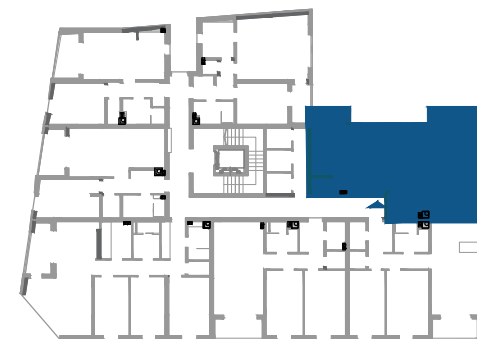
POZICIJA STANA U ZGRADI